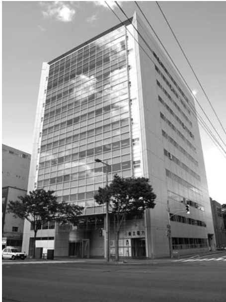
年金相談センター外観